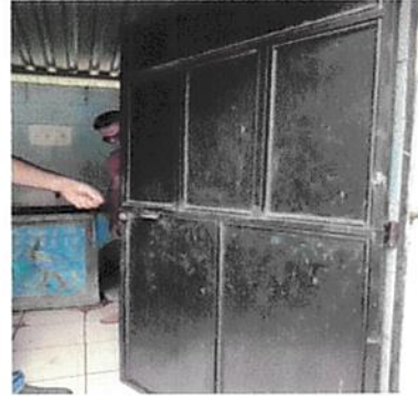
Foto 4: Mantenimiento de 8 puertas (Limpieza, pintura, chapa y pasadores)