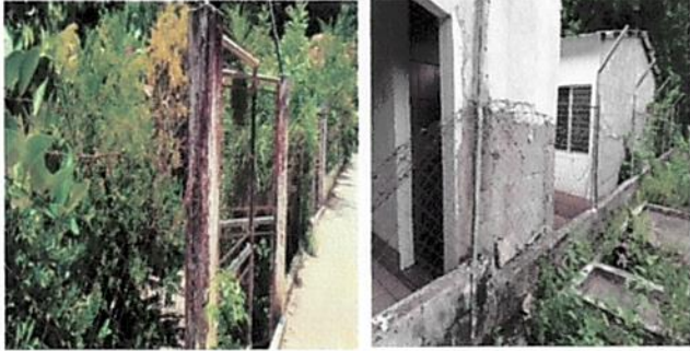
Foto1: Mantenimiento de tramos de circulación de malla con tubo y hierro de media